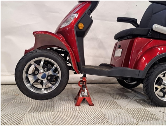
Nosta laitteen etupää korokkeelle.

Sisempää raidetangon päätä vaihdettaessa on vain huomioitava, että raidetangon sisäpäässä on vasenkätiset kiertet.