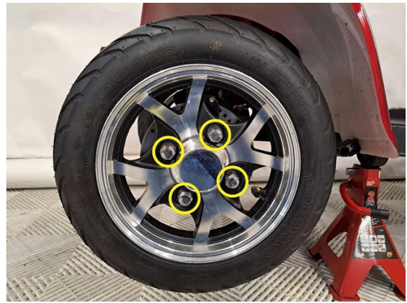
Irrota etupyörän kiinnitysmutterit. (hylsy 19 mm).