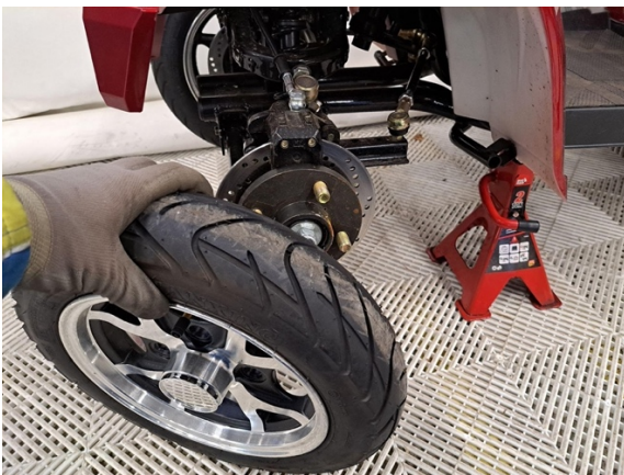
Ota etupyörä pois.