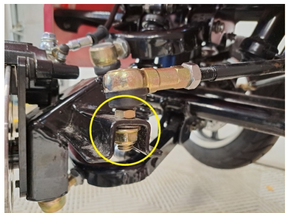
Irrota raidetangon pään mutteri. (hylsy 14 mm). Jos raidetangon pää pyörii tyhjä, niin raidetangon pään suojakumin puolella on kohta, josta voi pitää kiinni. (kiintoavain 12 mm).